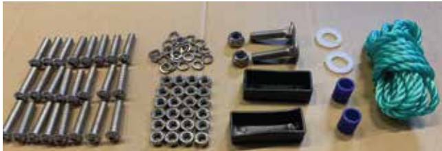
Deler 6 trinn