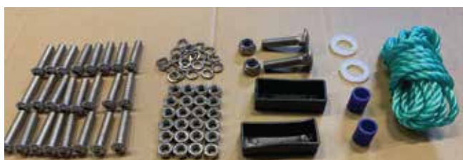
Deler 6 trinn

Forlenger kun til Bade /Bryggestrapp i stål