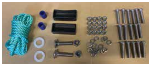
Deler 4 trinn

Forlenger kun til Bade /Bryggestrapp i stål