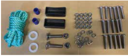
Deler 4 trinn